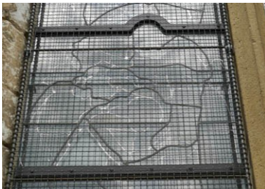
Une double peau, visible ici à Bourg Achard

Les casses intentionnelles sont dues à des personnes mal intentionnées qui projettent le plus souvent des cailloux contre les vitraux. L'objectif est alors de casser. Le seul moyen de se protéger est de protéger la baie. Attention alors à ne pas confondre les protections contre l'intrusion des protections contre le casse. L'intrusion est le fait de personnes qui veulent pénétrer dans l'édifice pour dérober des objets. Les barreaux de fer forment alors la meilleure des protections. Mais ils n'empêchent pas les cailloux d'atteindre et de casser les vitraux. Ils doivent être accompagnés par la pose d'un grillage en inox posé sur un canevas qui vient épouser les formes du vitrail. Notons que le grillage type « cage à poules » est trop faible et qu'il peut se déformer et conduire à ce que le projectile atteigne quand même le vitrail. Mieux vaut l'inox, certes plus onéreux et plus visible, mais qui remplit bien son rôle. Dans certains vitraux remarquables, un double peau en verre coloré et façonné en reprenant les formes présentes sur les vitraux est posé avant le grillage pour préserver les vitraux contre les jets divers mais aussi la pollution ou les UV.